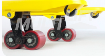
Ruedas de Poliuretano tipo tándem.