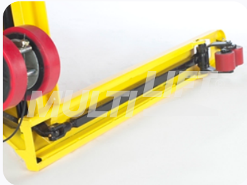
Construcción ultra reforzada.