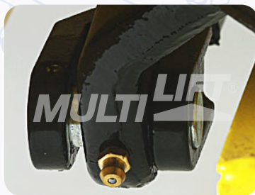
Graseras de lubricación en punto clave.